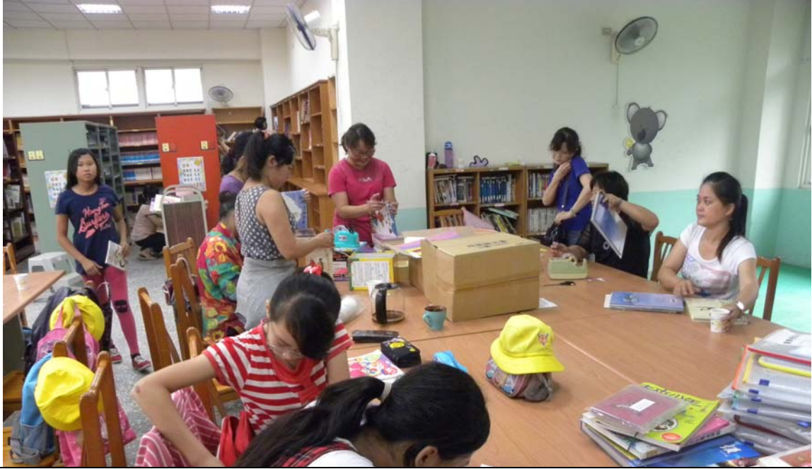
說明：圖書志工整理書籍。