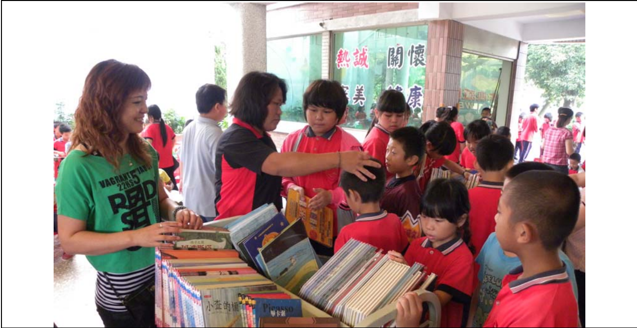
說明：圖書志工協助辦理「秋季賞書會」。