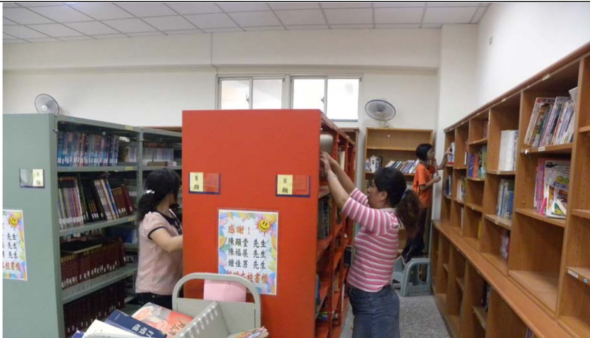
說明：圖書志工每天排班至圖書室整理書籍。