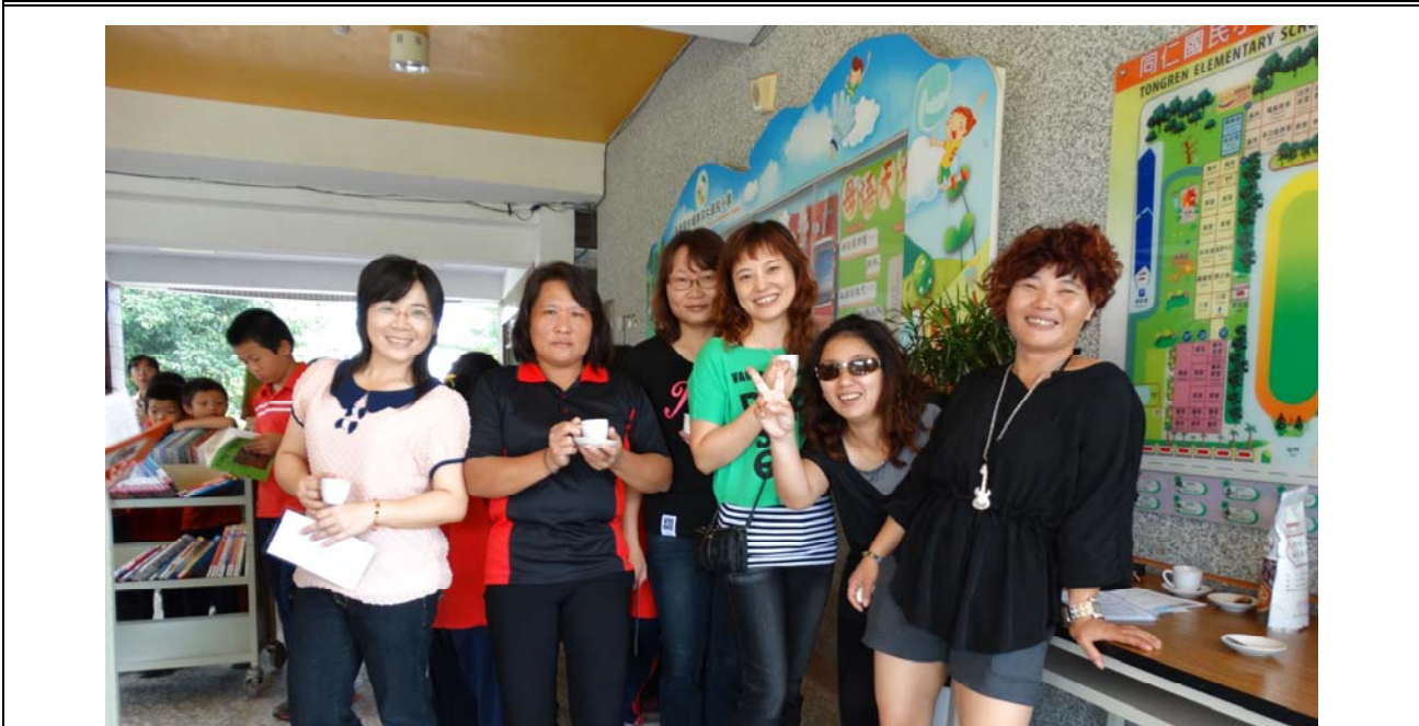
說明：熱心可愛的圖書志工。